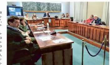
Un momento della riunione dei sindaci fontanini